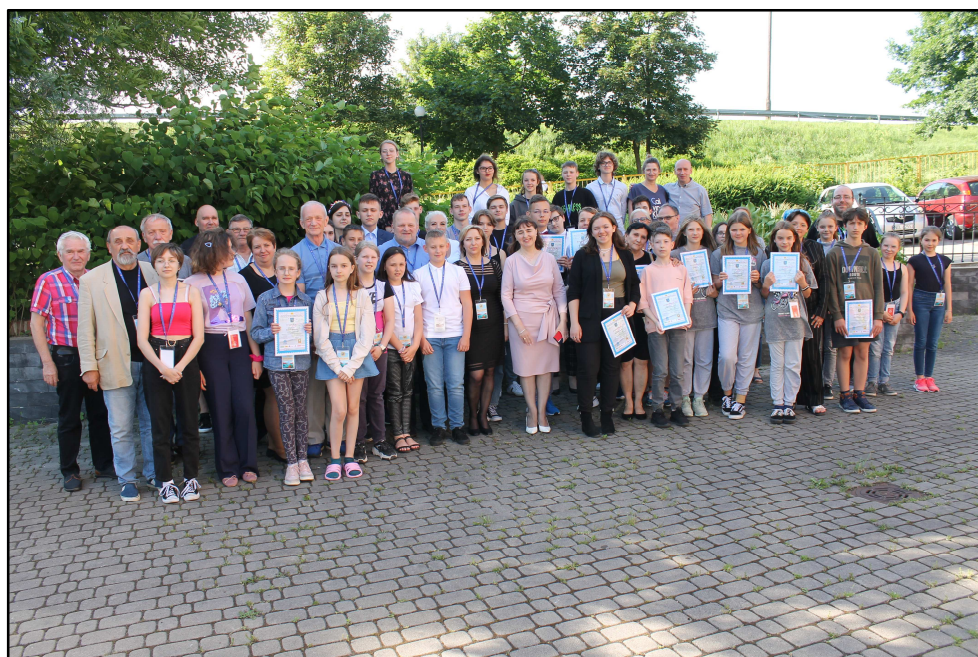
Uczestnicy finału 60. OMKF „Łława w krainie Warmii i Mazur”