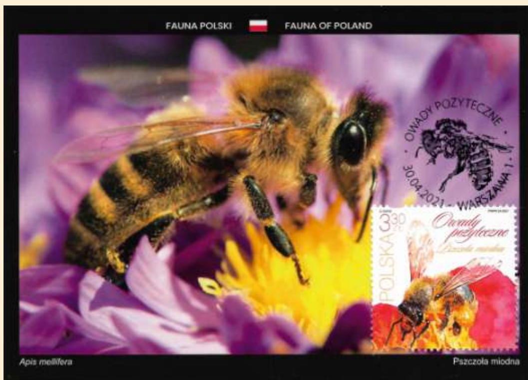
Pierwsze miejsce – Polska – Pszczoła miodna Autor: Sławomir Bem; Wyd.: House of postcards; Stempel FDC Warszawa-30/04/2021

Do zwycięskiej karty użyty został znaczek z wprowadzonej do obiegu 30 kwietnia 2021r. przez Poczta Polską serii „Owady pożyteczne” przedstawiającej owady zapylające, odgrywające istotną rolę w naturalnym ekosystemie. Celem emisji było zwrócenie uwagi na znaczenie ochrony środowiska oraz działań proekologicznych w społeczeństwie. Autorem projektu znaczka był Andrzej Gosik.