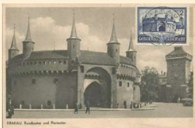
Zn. /Fi. 63/ Barbakan Wydawca kartki Akropol Kraków Stempel dzienny Kraków 1 23.5.