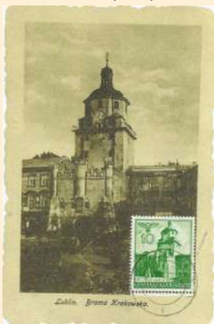
Zn. /Fi. 42/ Lublin - Brama Krakowska Wydawca kartki Sztuka Stempel dzienny Lublin 16.12.1940r.

Mimo utraty niepodległości przez Polskę w latach 1939-45 polscy filatelisci zajmowali się wykonywaniem kart maksimum. Do tego celu używano także kartek wydanych w Polsce przed wojną.