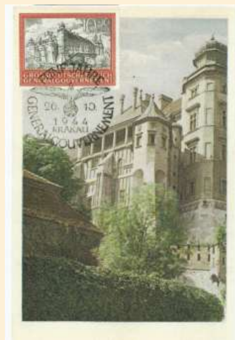
Zn. /Fi. 125b/ Wawel Wydawca kartki nieznany Stempel okolicznościowy Kraków 26.10.1944