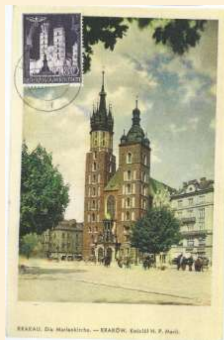
Zn. /Fi. 50/ Kościół Mariacki w Krakowie Wydawca kartki nieznaný Stempel dzienny Kraków