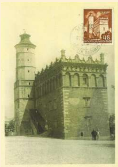
Zn. /Fi. 69/ Ratusz w Sandomierzu Wydawca kartki nieznany Stempel dzienny Sandomierz 07.2.44