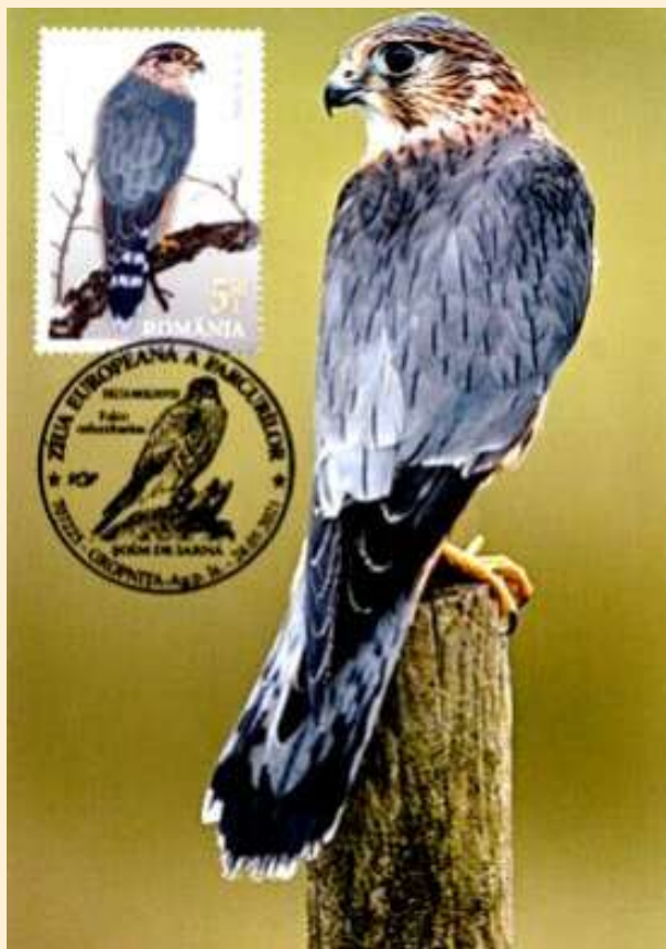
Drugie miejsce – Rumunia – Sokół

Drugie miejsce w konkursie zajęła Rumunia, trzecie Hiszpania. Karty, które zajęły drugie i trzecie miejsce przedstawiono poniżej.