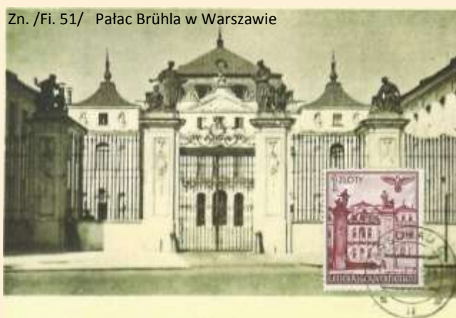
Zn. /Fi. 51/ Pałac Brühla w Warszawie