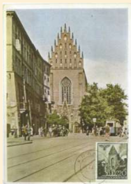
Zn. /Fi. 44/ Kościół Dominikanów w Krakowie Wydawca kartki nieznanym Stempel dzienny Kraków 06.7.41r.