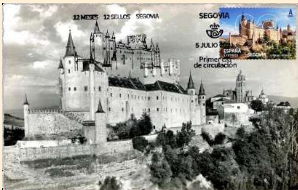
Trzecie miejsce – Hiszpania - Alkazar w Segowii

Autor: George Gligor; Wyd.: Eine Groch Kartee; Stempel okolicznościowy Gropnita-24/05/2021