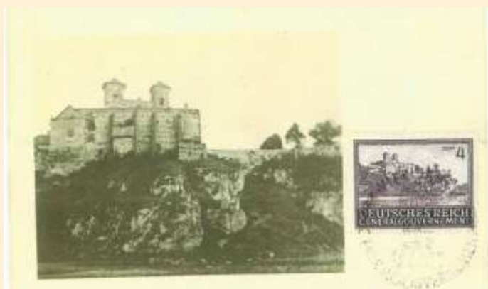
Zn. /Fi. 114/ Klasztor w Tyńcu Wydawca kartki nieznany Stempel okolicznościowy Kraków 26.X.1943