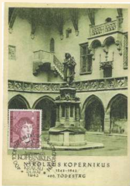
Zn. /Fi. 104/ M. Kopernik Wydawca kartki ZKW Druck Krakau Stempel okolicznościowy Kraków 24 maj 1943