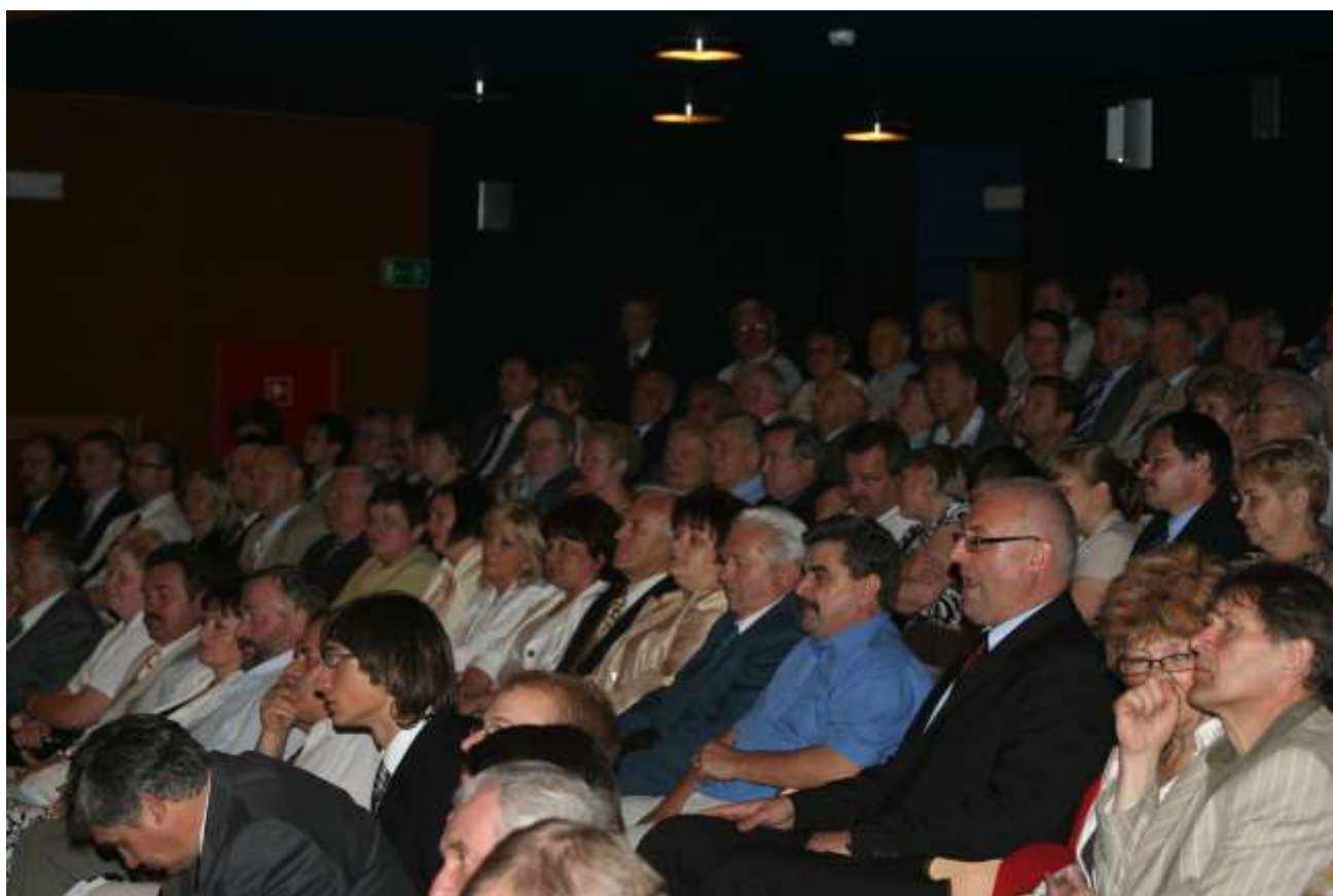
Sala była wypełniona po brzegi.