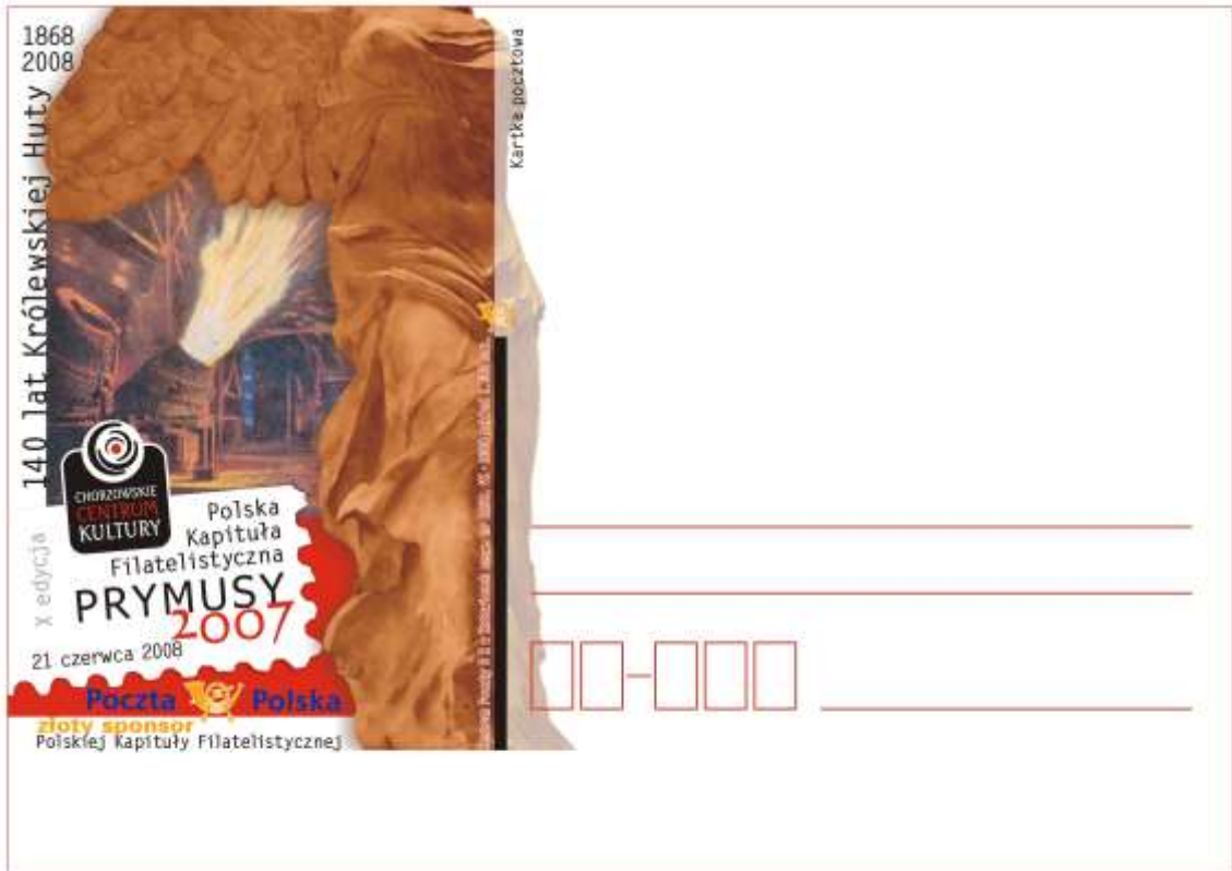
Kartka beznominalowa wydana przez Polską Kapitułę Filatelistyczną z okazji 140 lecia Królewskiej Huty