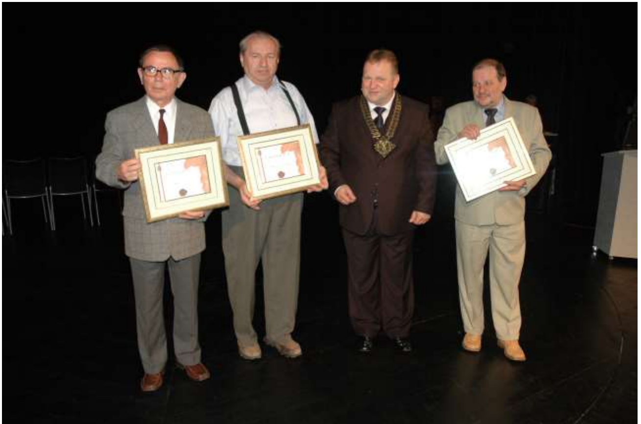
Na zdjęciu delegaci Przedstawicielstw Kapituły po otrzymaniu Certyfikatów.

W końcu nadeszła długo wyczekiwana chwila. Na ekranie prezentacji multimedialnej pojawiła się nazwa pierwszej kategorii. Prezes Kapituły wywoływał na scenę po dwie osoby wywodzące się z wcześniejszych laureatów w danej kategorii, które posiadały zaklejoną kopertę z nazwiskiem zwycięzcy oraz dwie osoby spośród gości, które asystowały przy wręczaniu statuetek PRYMUS. Po otrzymaniu statuetki, każdy laureat miał swoje 30 sekund na wypowiedź. Pozostali nominowani otrzymali okolicznościowe dyplomy nominata. Wszyscy laureaci kolejno zajmowały miejsca w