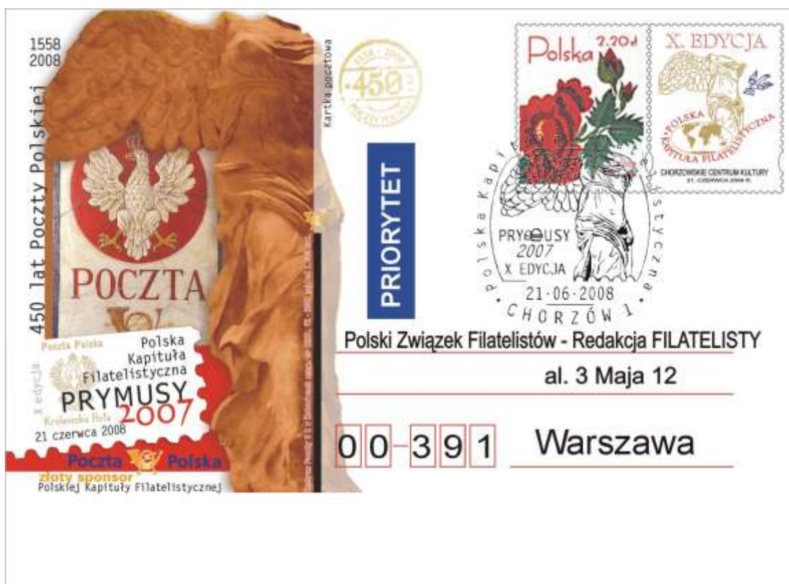
Kartka beznominalowa wydana przez Polską Kapitułę Filatelistyczną z okazji 450 lecia Poczty Polskiej.