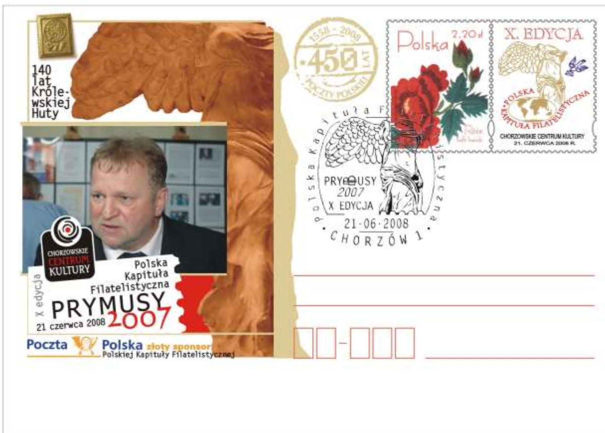
Koperta do personalizacji podczas Gali

W holu Chorzowskiego Centrum Kultury na 12 sztalgach przygotowano prezentację historii dziesięciolecia Polskiej Kapituły Filatelistycznej.