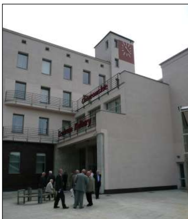
Długo przed godz.12.00 przybyli pierwsi goście X Gali Prymusów.

W tym roku obchodziliśmy dziesięciolecie powołania do życia Polskiej Kapituły Filatelistycznej podczas uroczystego spotkania Okręgowego Kolegium Sędziów Okręgu Śląsko-Dąbrowskiego PZF oraz Okręgu Opolskiego PZF, podczas trwania Krajowej Wystawy Filatelistycznej „Chorzów’98” z okazji 100-lecia Elektrowni Chorzów. Po dziesięciu latach Polska Kapituła Filatelistyczna ponownie zawitała do Chorzowa. Tym razem Zarząd Kapituły powierzył Oddziałowi PZF w Chorzowie organizację uroczystej Gali. Na miejsce uroczystego spotkania wybrano oddane w tym roku do użytku bardzo nowoczesne Chorzowskie Centrum Kultury. W dniu 21 czerwca 2008 r. punktualnie o godz. 12.00 w Chorzowskim Centrum Kultury przy ul. Sienkiewicza 3 rozpoczęła się X Gala wręczenia Statuetek „PRYMUS” przyznawanych przez Polską Kapitułę Filatelistyczną wyróżniającym się swoją działalnością osobom i zespołom osób będących członkami Polskiego Związku Filatelistów.