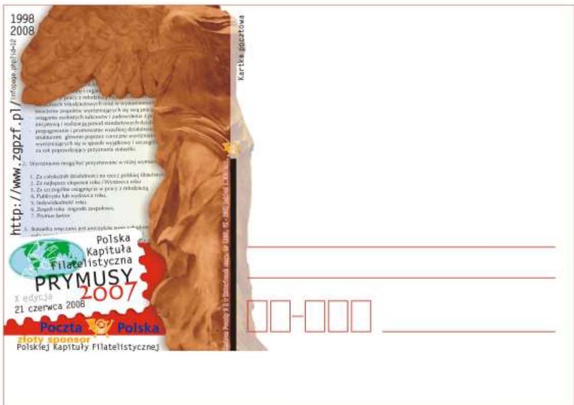
Kartka beznominalowa wydana przez Polską Kapitułę Filatelistyczną z okazji X Gali