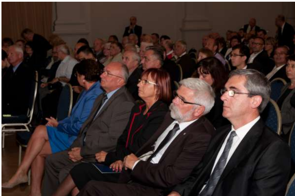
Członkowie Komitetu Honorowego XIII Gali Prymusów

W czasie trwania Wystawy – w sobotę przed południem – w kargowskim Gminnym Ośrodku Kultury im. Wilhelma Blanke odbyła się XIII Gala Prymusów.