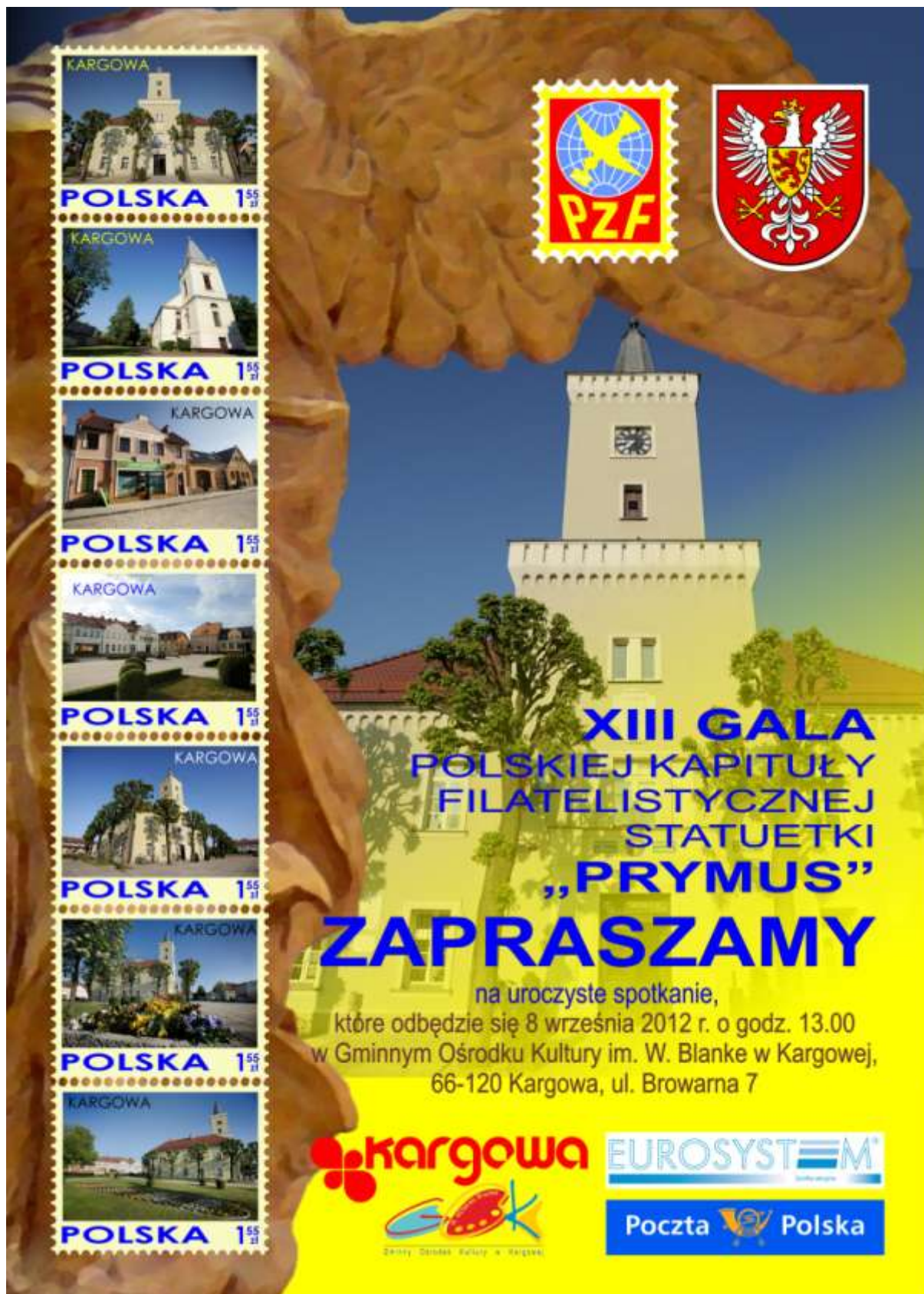
Plakat wystawy. Autor projektu: Henryk Monkos. Format 50 x 70 Nakład 100 szt.