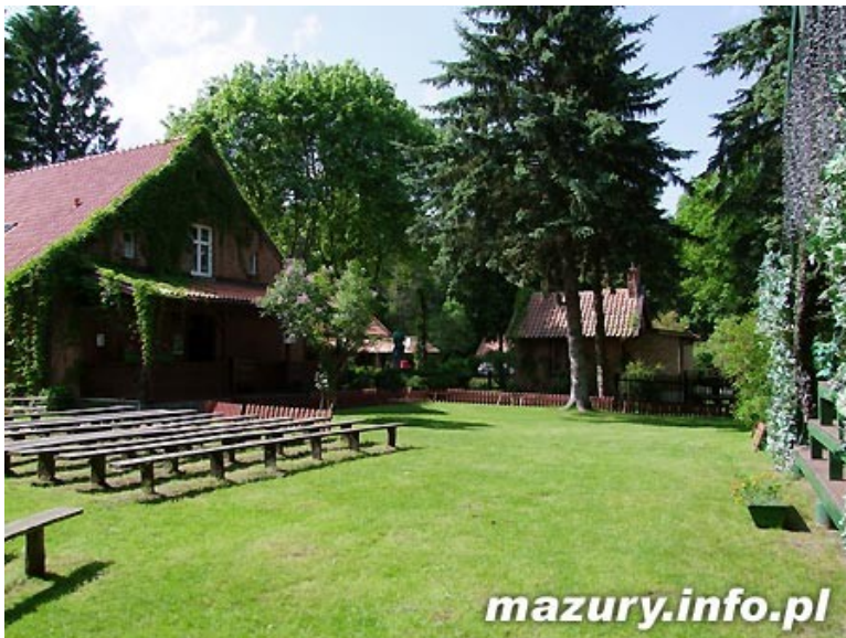
Rezerwat żubrów Wolisko.

Zespół Wielkich Jezior Mazurskich to kraina o powierzchni 1700 km 2 . Zasób wody to ¼ ogółu polskich jezior. Największe z nich to: Śniardwy – największe Polskie jezioro, Mamry najzwyklejsze w wodę jezioro w Polsce, Jeziorak – najdłuższe jezioro w Polsce 27 km. Wiele jezior połączonych jest kanałami żeglownymi. Szlak Wielkich Jezior Mazurskich ma długość 88 km.